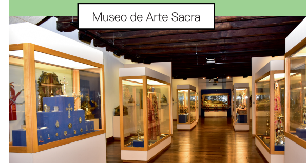
Museo de Arte Sacra

Hoxe en día, varias firmas seguen mantendo a tradición e pugnan por poñer o calzado monfortino entre os mellores do mundo.