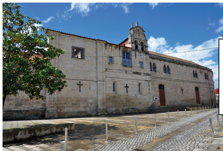
Convento de Sta. Clara