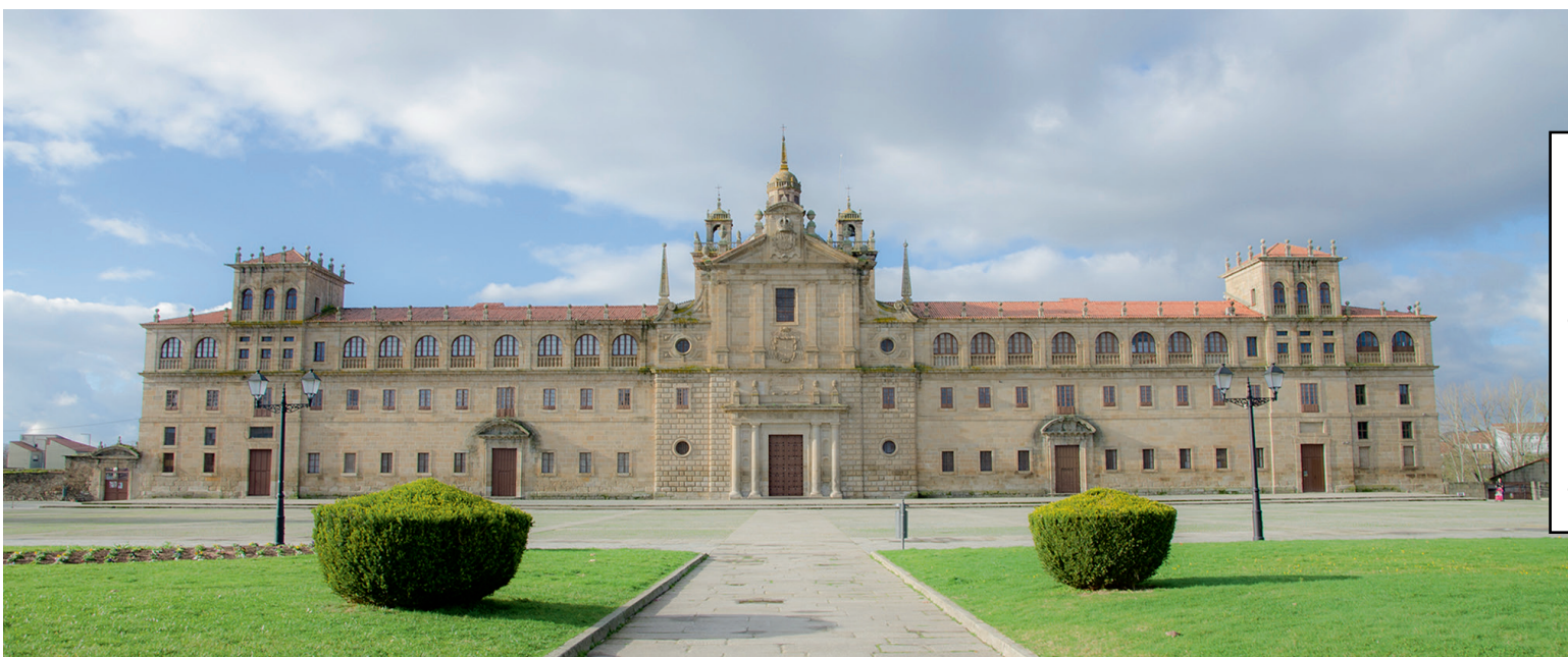
Colexio de Nosa Señora a Antiga

O cardeal Rodrigo de Castro propulsou esta obra en terreos cedidos polo concello. O edificio proxectouse coa intención de convertelo en centro cultural e museo, ademais de panteón familiar. Nos seus inicios e ata o ano 1767 estivo rexentado pola Compañía de Xesús. Ao longo do tempo tivo distintos usos, sendo o máis ilustre o de Real Seminario de Estudos. Colexio do Cardeal, da Compañía ou dos Escolapios son os nomes polos que popularmente é coñecido.