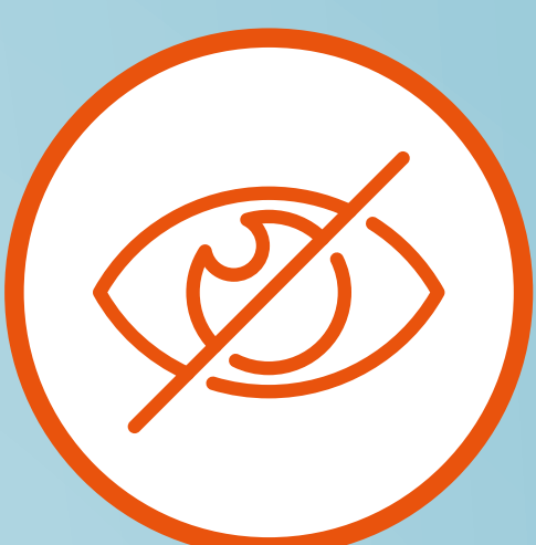
Pérdida de visión