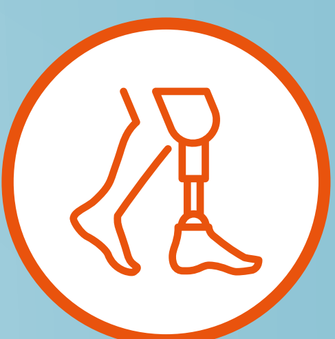
Amputación de miembros inferiores

Se estima que más de 700 MILLONES de personas vivirán con diabetes en 2045