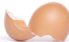
Cascas de ovo