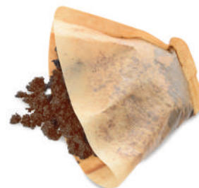
Pousos de café e infusións