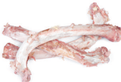
Restos de carne