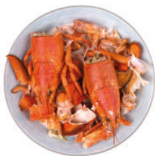
Restos de marisco