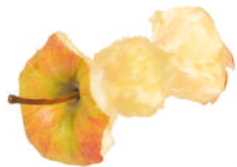
Restos de froitas