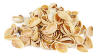
Restos de froitos secos