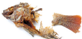
Restos de peixe