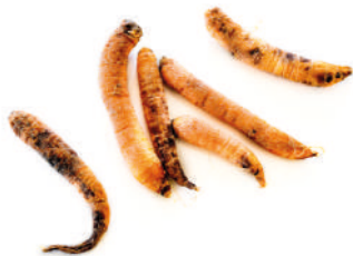
Restos de verduras